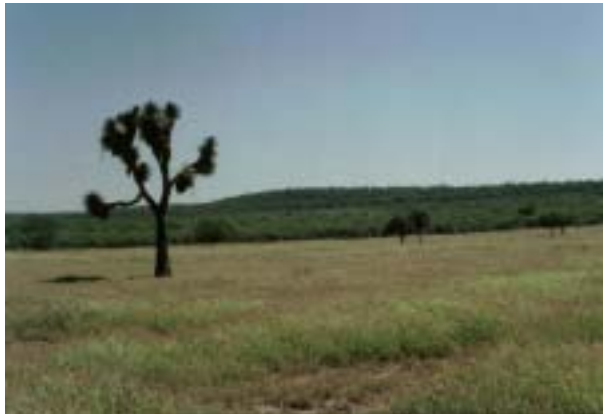
Fig. 2. ¿Cual es y será el efecto del cambio climático en ecosistemas tales como los pastizales y matorrales que dominan el Norte de México?. Lamentablemente no lo sabemos y urge conocerlo.

Fenología de las plantas. Existen muy pocas regiones en el planeta donde las condiciones ambientales sean continuamente favorables para todas las funciones de las plantas, lo que sí es frecuente es