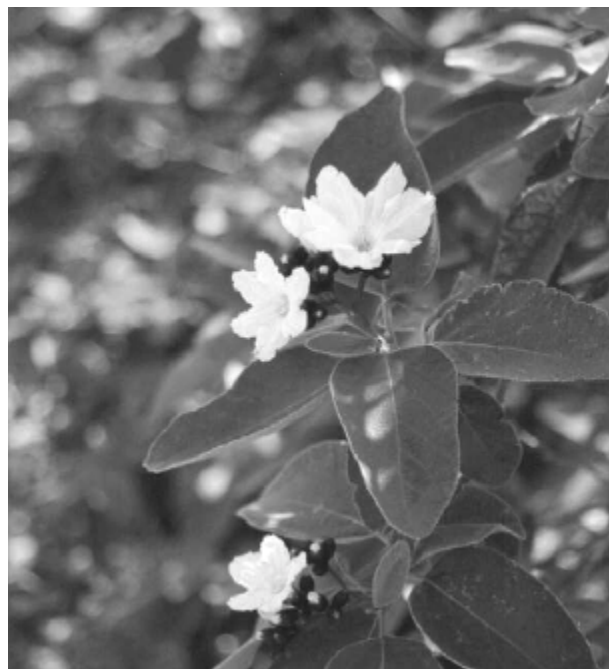
Fig. 4. "Anacahuíta" ( Cordia boissieri ). ¿Como son y serán afectados los patrones fenológicos en las plantas de nuestra región donde sabemos que uno de los factores determinantes en su desarrollo es el agua, más que la temperatura?.

Las observaciones fenológicas son una valiosa fuente de información para investigar las relaciones entre la variación climática y el desarrollo vegetal. La floración es considerada como una de las eta-