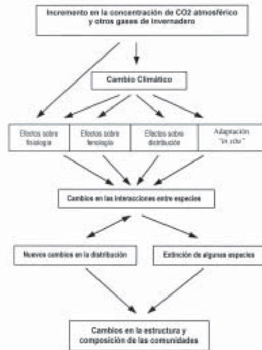
Fig. 1. Efectos principales del cambio climático pronosticado sobre la vida en el planeta. Adaptado de Hugues (21).

En los últimos años se han propuesto múltiples modelos predictivos del cambio climático, considerando cada uno de ellos una diversidad de varia-